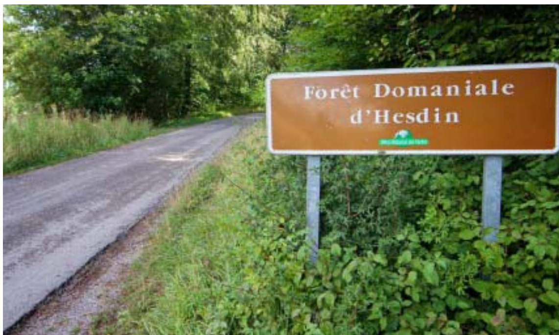
Des recherches ont eu lieu mardi soir dans la forêt d'Hesdin.

HESDIN. Mardi soir, vers 21 heures, un accident s'est produit entre un poids lourd et une voiture.