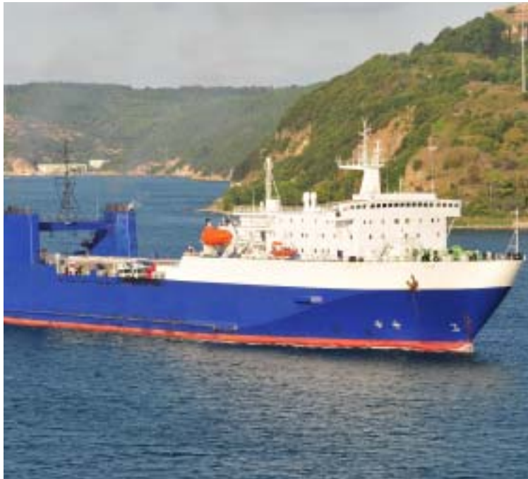
Cet ancien train-ferry a subi de grosses transformations en Pologne. Une usine de production d'eau en bouteilles a notamment été aménagée dans un des garages.

Pour cela, OFW Ships a fait construire une usine en Chine et vise une production hebdo-